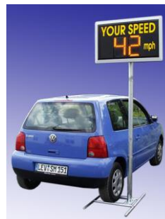
“MoMa” Mobiler Universalsteckmast

Die mobilen Masten von wavetec ermöglichen Ihnen den flexiblen Einsatz der Speed Displays - zum Standortwechsel ohne Probleme.