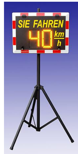
“TriMa” Mobiler Dreibeinmast

Für weitere Informationen fordern Sie bitte unsere detaillierten Datenblätter der jeweiligen Produkte an.