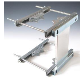
“MaMobil” Schnelleinhängensystem, besonders variabel