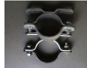
“Ma 60” bzw. “Ma 70” Schraubsschellen

Handelsübliche Schellensysteme zum Befestigen der Speed Displays an vorhandenen Masten.