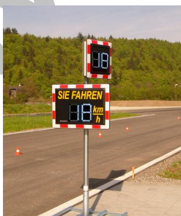
Anzeigetafel mit Passiv-Anzeige in der Anwendung

Für weitere Informationen zu den Anzeigevarianten fordern Sie bitte unsere technischen Datenblätter an.